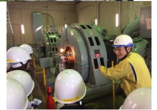
福岡第一発電所内にて